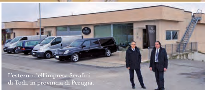
L'esterno dell'impresa Serafini di Todi, in provincia di Perugia.

Racchiusa in tre differenti cerchi di mura concentriche, la città di Todi si mostra in tutto il suo splendore già mentre ci prepariamo a risalire il colle sul quale è appoggiata.