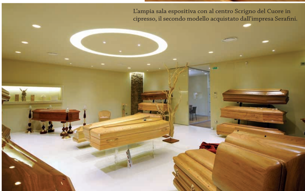
L'ampia sala espositiva con al centro Scrigno del Cuore in cipresso, il secondo modello acquistato dall'impresa Serafini.

«Abbiamo infatti già altri modelli esposti nella nostra sede di Todi ma Scrigno del Cuore ci ha particolarmente colpito non solo dal punto di vista estetico ma anche perché in grado di emozionare. L'idea dei cuoricini in legno da prelevare e conservare è indubbiamente innovativa, così come gli accessori che rendono il rito del commiato ancora più emozionante, dal libro firme al libretto che spiega la cerimonia ai partecipanti».